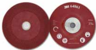
Оправки для кругов на фибровой основе